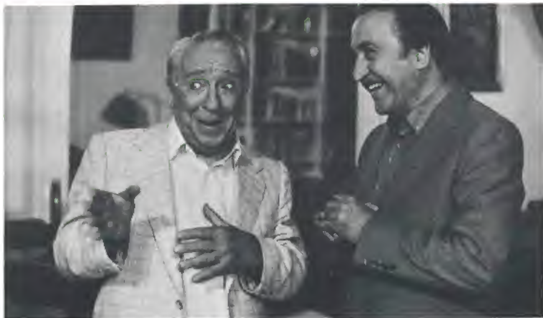
Paco Martínez Soria - Rafael Alonso